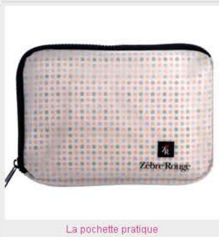
La pochette pratique

Commençons par le PRATIQUE, avec une petite nouveauté dans mon vanity, le kit femme de la gamme Long Courrier Zèbre Rouge. C'est la trousse idéale pour les week-ends improvisés car elle est très complète : elle contient 5 produits et 2 accessoires, une mini brosse à dents et un peigne. Un gel douche rose fluo, un shampoing doux, un soin corporel, une eau démaquillante et un dentifrice, d'une contenance de 30 ml, se présentent en flacon airless, facilitant ainsi une utilisation aisée et économique. Du trèfle rouge, aux propriétés anti-oxydantes, et de la mauve, émoulliente et rafraîchissante, rendent les soins agréables et performants. La trousse, garnie de petites fleurs multicolores, est elle aussi très pratique car, plate et zippée, son encombrement est minimal.