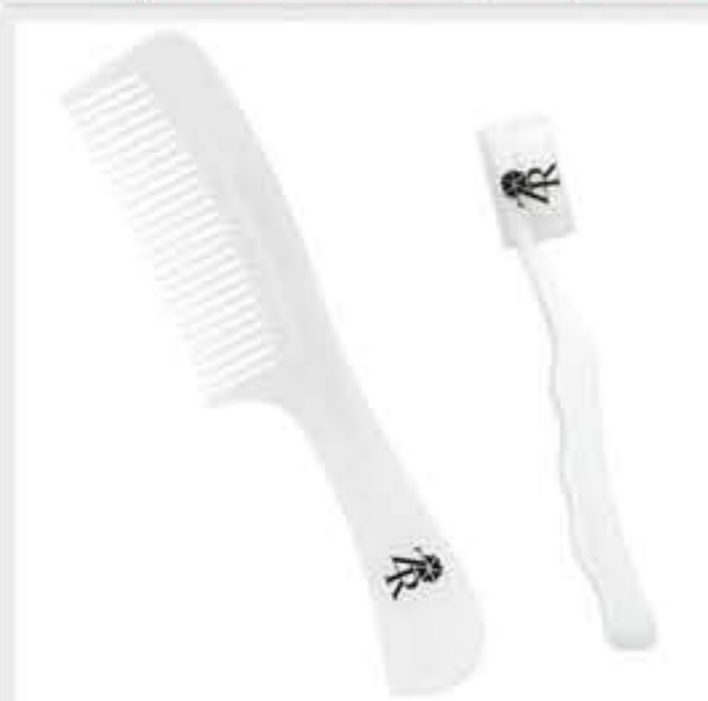
Les 2 accessoires du kit : Peigne et brosse à dents