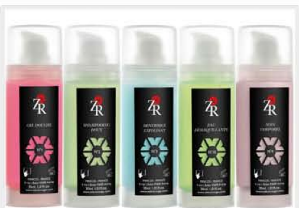
Kit pour l'avion Zèbre rouge Long courrier pour femme